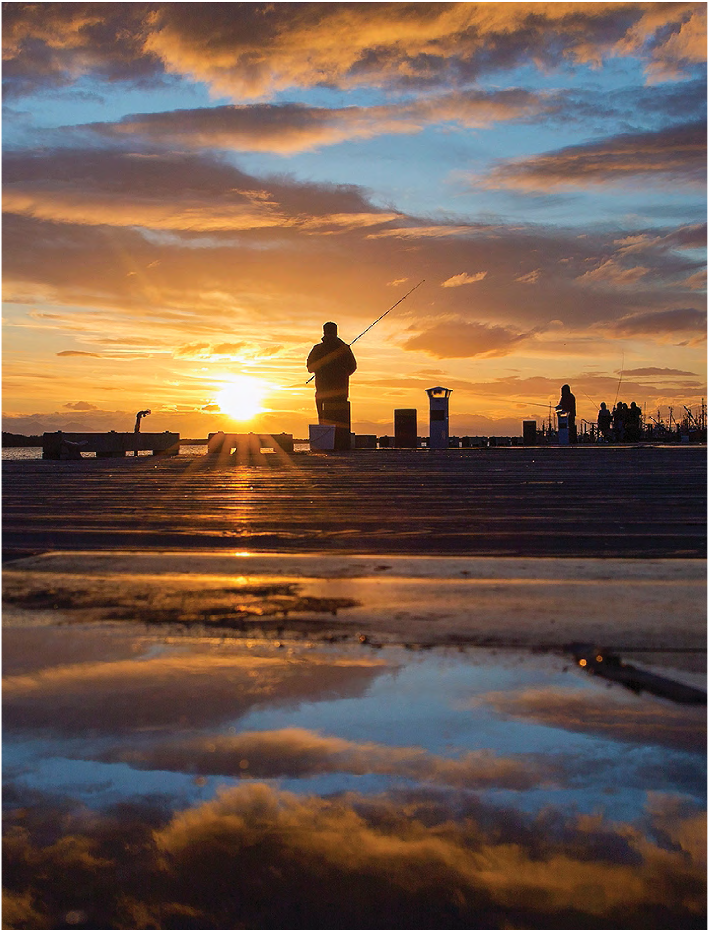
Imperial Landing 漁人碼頭