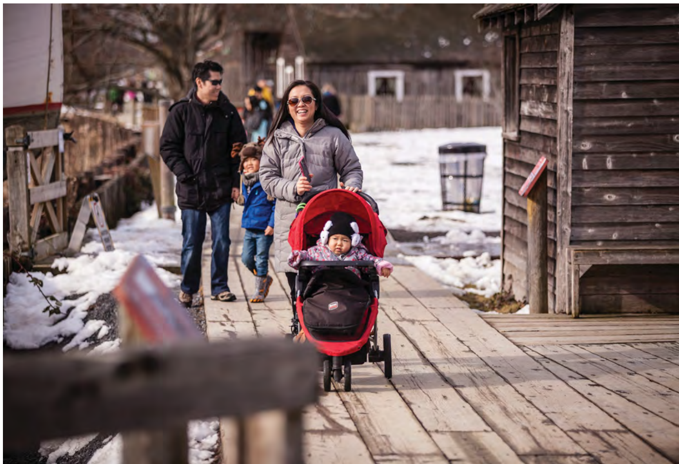
不列顛尼亞歷史船塢

時至今日，列治文繼續吸引到來自加拿大其他地區以及世界各地的移民。近年來，本地新移民主要來自中國、香港、菲律賓及印度。本市的多元文化，使列治文成為活力充沛、多姿多采的生活地點。