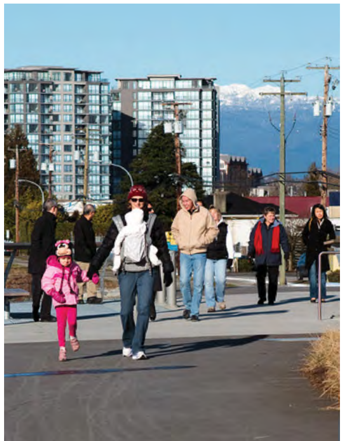
列治文奧運速滑館一帶 (Oval Village) 發展蓬勃

Chimo列治文租金銀行 (Chimo Richmond Rent Bank) 可以為需要支付按金、可能因拖欠租金而面臨迫遷、或暫時資金短缺或財務困難而令必要公用設施被停用的低收入人士及家庭提供必須償還的應急資金。這些資金以免息短期貸款的形式提供。詳情請致電604-279-7170或瀏覽 www.ChimoServices.com/get-help/chimo-richmond-rent-bank