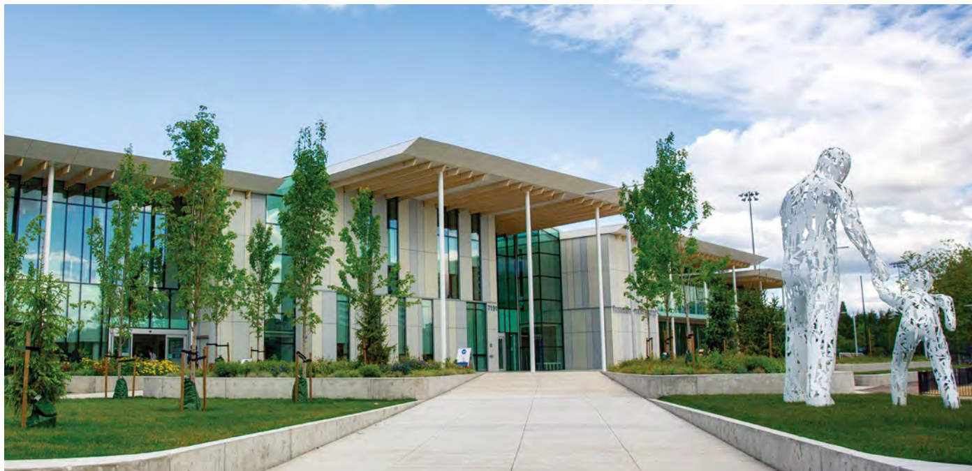
明納魯活躍生活中心