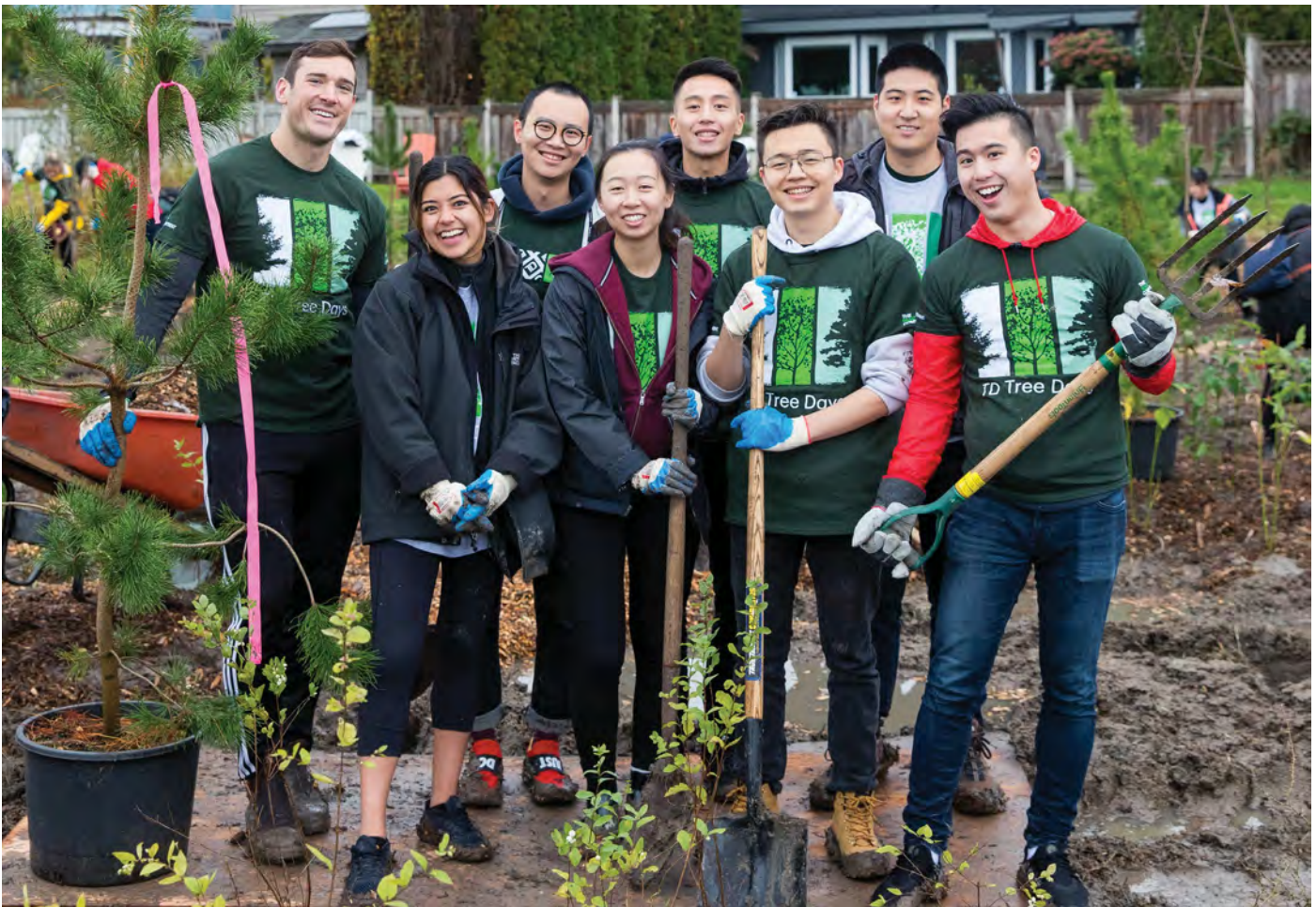
Terra Nova 郊野公園的義工

列治文商會 (Richmond Chamber of Commerce) 是多元化的非牟利商界會員組織，代表近1,000間會員企業的權益，並提供與其他會員促進關係的機會。商會成員來自不同行業及專業，包括全國及跨國企業、中型企業、新創公司及小型企業。詳情請瀏覽： www.RichmondChamber.ca