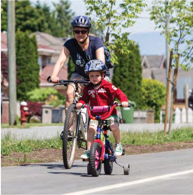
鐵路綠色走廊 (Railway Greenway)

列治文地勢平坦，非常適宜騎單車，市內也有由道路單車線、郊外單車徑及綠色走廊組成的廣大網絡。在列治文騎單車必須配戴頭盔，除非這樣做會影響到必要的宗教行為。騎單車時沒有配戴頭盔，可能會被罰款。有關單車路線、安全提示及規則的資訊，請瀏覽： www.richmond.ca/cycling